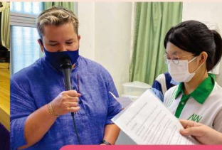
Morning Assembly Sharing