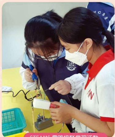
STEAMS 電路接駁學習活動