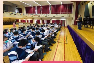
S1 & S2 Mini Concert