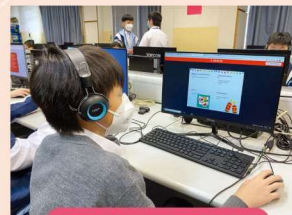
Book Creator Workshop