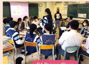
S4 Drama Class