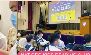
NAT GEO KIDS READING CLUB Seminar