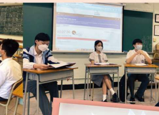
S6 Speaking Exam Practice