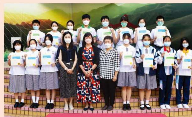
Speech Festival Awardees