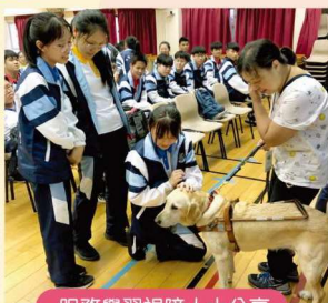
服務學習視障人士分享