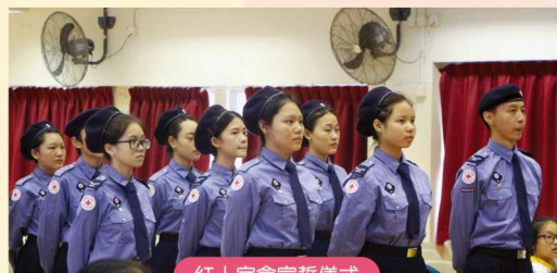
紅十字會宣誓儀式