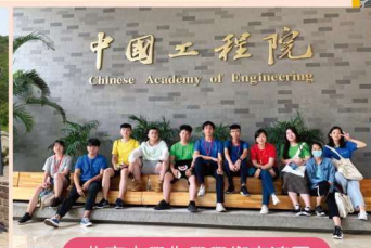
北京大學化學學術交流團