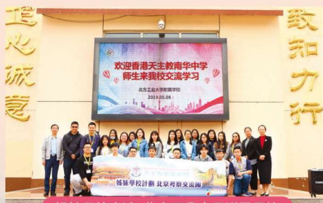
姐妹學校交流 北方工業大學附屬學校