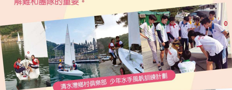
清水灣鄉村俱樂部 少年水手風帆訓練計劃