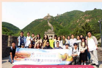
北京考察交流團 八達嶺長城