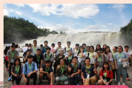
貴州歷史文化自然天文考察團 黃果樹瀑布