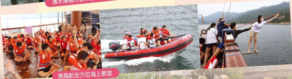
乘風航全方位海上教室