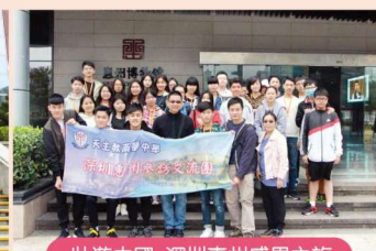
壯遊中國 深圳惠州感恩之旅