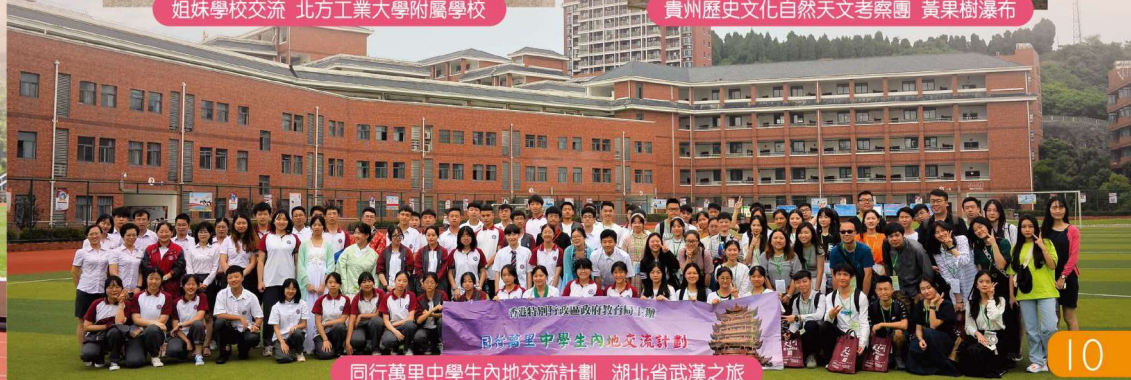
同行萬里中學生內地交流計劃 湖北省武漢之旅