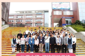
壯遊中國 探訪同勝學校